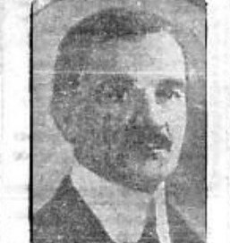
Trecând la situația economică, d. Maniu arată că deși locașurile din Aprilie a. c. au fost cu 300 milioane lei mai mult ca în Aprilie a. tr. totuși faceștrile sunt

Deșgur că este o măsură severă și grea, dar vor veni poate altele și mai grele.